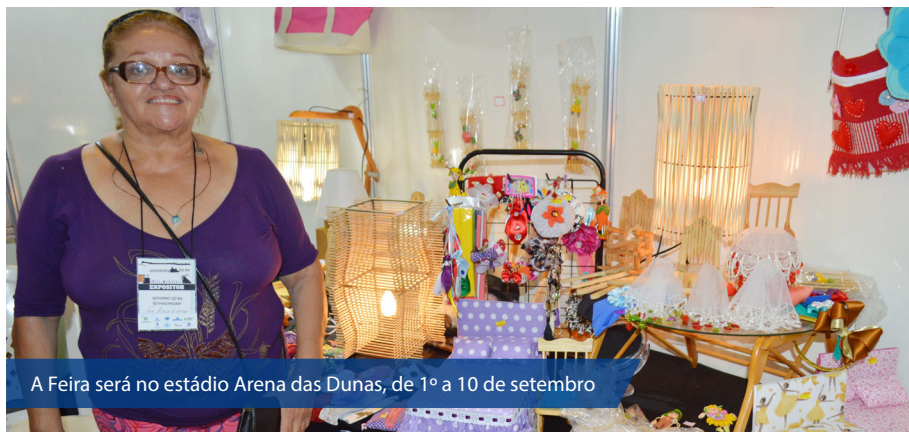
A Feira será no estádio Arena das Dunas, de 1º a 10 de setembro

Começaram as inscrições para os artesãos participarem da 23ª Edição da Multifeira Brasil Mostra Brasil. As inscrições podem ser feitas até hoje (10), conforme edital publicado no Diário Oficial. A Feira será no estádio Arena das Dunas, de 1º a 10 de setembro.