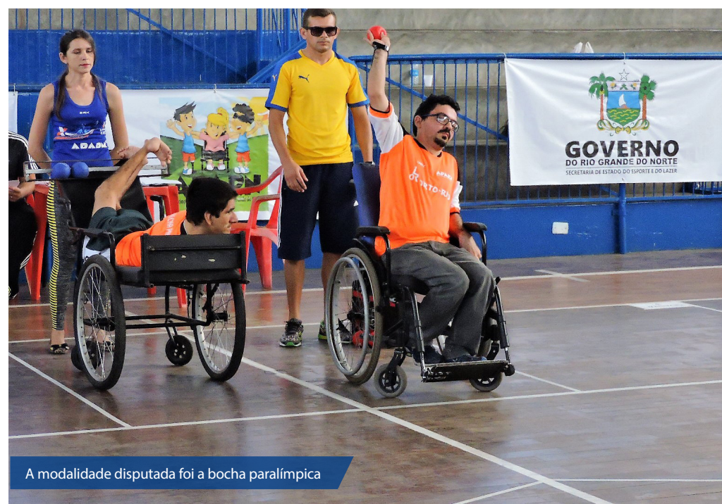
A modalidade disputada foi a bocha paralímpica

Os Jogos Paradesportivos Escolares do Rio Grande do Norte são para os alunos regularmente matriculados na rede de ensino fundamental, médio ou especial da rede pública ou privada do Estado com deficiência física, visual e intelectual, e idade mínima de 12 anos e máxima de 17 anos. A competição vai selecionar os atletas que representarão Rio Grande do Norte nas Paralimpíadas Escolares, evento nacional promovido pelo Comitê Paralímpico Brasileiro (CPB), no mês de novembro, em São Paulo.