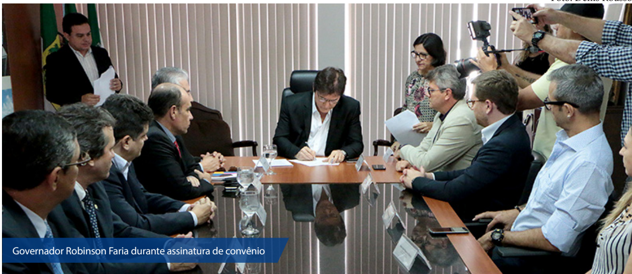
Governador Robinson Faria durante assinatura de convênio

Uma nova ação do Governo do Estado vai permitir a oferta de mais dois mil imóveis para aquisição pelo servidor público estadual e municipal. Isto foi possível com a assinatura pelo governador Robinson Faria de um convênio com o Secovi – Sindicato das Empresas de Compra, Venda, Locação e administração de imóveis do Rio Grande do Norte, que representa as imobiliárias, incorporadoras, loteadoras e empresas urbanizadoras e com o Creci – Conselho Regional de Corretores de Imóveis do RN. “Vocês são bem-vindos a esta parceria. Vamos fortalecer e multiplicar os programas Moradia Cidadã e Moradia Cidadã Municípios. Com isso vamos atender a demanda na capital e no interior, gerar oportunidades de trabalho e incentivar a economia”, afirmou o governador aos dirigentes das duas instituições em ato realizado no início da tarde deste dia 08, na Governadoria.