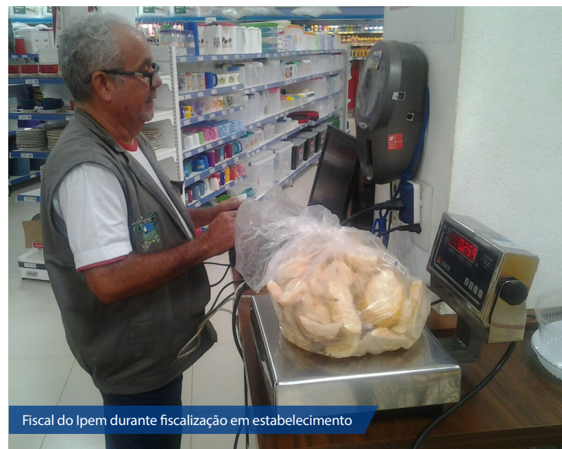
Fiscal do Ipem durante fiscalização em estabelecimento

Já a nova sede do Ipem vai funcionar com laboratórios metrológicos e de conformidade de produtos e com atendimentos aos consumidores e empresários, na rua Deuzanira Deuza de Lima, número 25, no bairro Alto de São Manoel. A inauguração da nova sede também vai acontecer em no dia 16 de agosto de 2017.